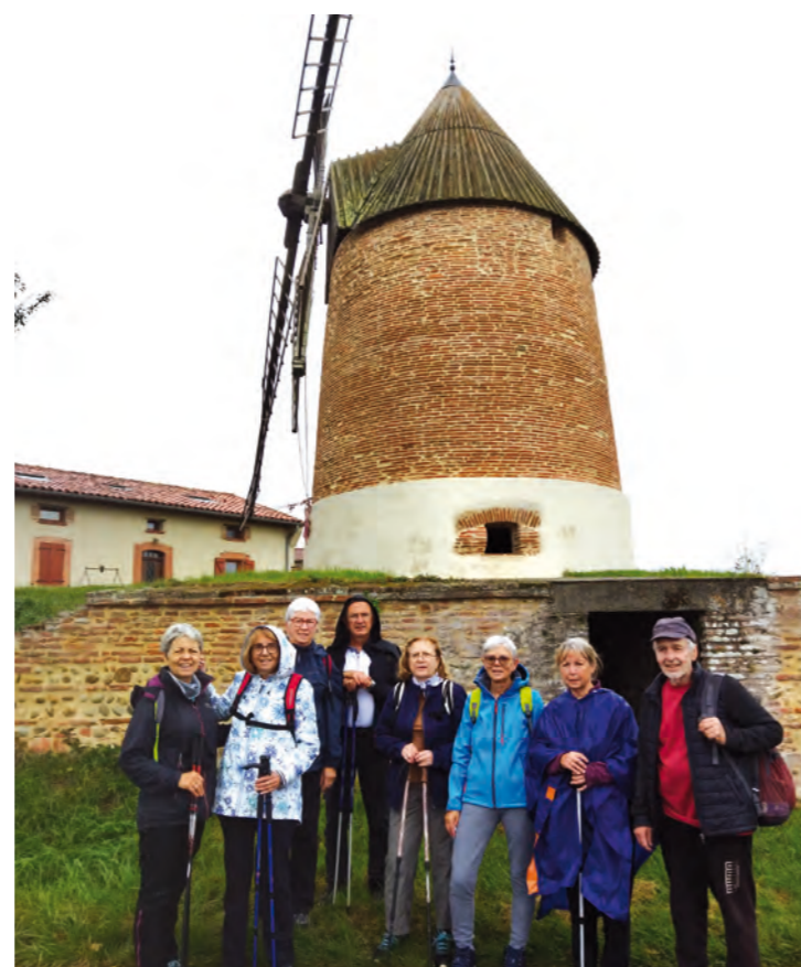
Randonnée du 15 novembre organisée par le foyer rural

puis de 19h à 20h), les activités randonnée (mercredi matin) et la marche nordique (samedi matin), mais aussi les rendez-vous musique le jeudi en fin de journée et le cercle de lecture dont la prochaine réunion se tiendra le 21 décembre à 20h30; autant d'occasions de partager, d'échanger et de se défouler dans une ambiance de grande convivialité.