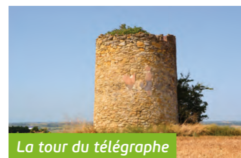
La tour du télégraphe

Le départ de cette nouvelle randonnée se situe à côté de la gare SNCF de Villefranche-de-Lauragais.